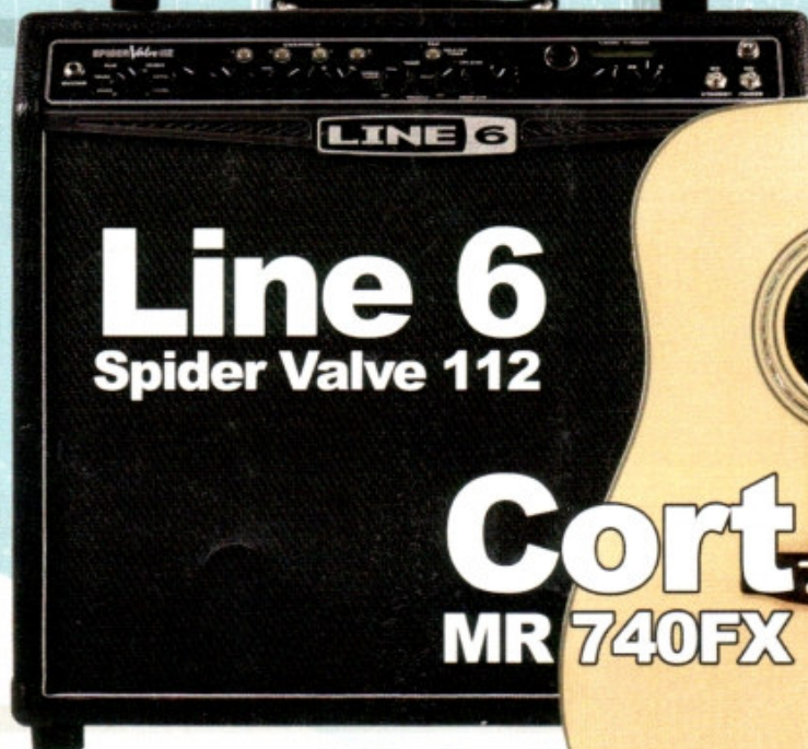
Cort MR 740FX