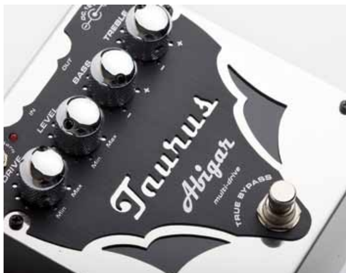
Kategoria multi-drive sugeruje, iż po włączeniu Abigara czeka nas długa podróż po krainie przesterowanych brzmień.

Nie lubię pożegnań i dlatego w tym przypadku z co najmniej z dwoma z serii nowych Taurusów EFX zamierzam zaprzężyć się na dłużej (choć cała piątka „trzy-ma fason” i nie ma w niej słabych punktów). Rozsądna kolejność połączenia ich w łańcuchu to: gitara – Abigar (drive), Tux (kompresor), Vechoor (chorus-flanger), Zebu (reverb-delay), T-Di (preamp). Dla Waszego spokoju napiszę jeszcze: nic nie stuka, nie trzeszczy, nic nie brumi, nie ma trzasków przy włączaniu/wyłączaniu. Urządzenia są trwałe, łatwe w obsłudze i według mnie oraz większości muzyków, z którymi się spotkałem, brzmiały zadowalająco.