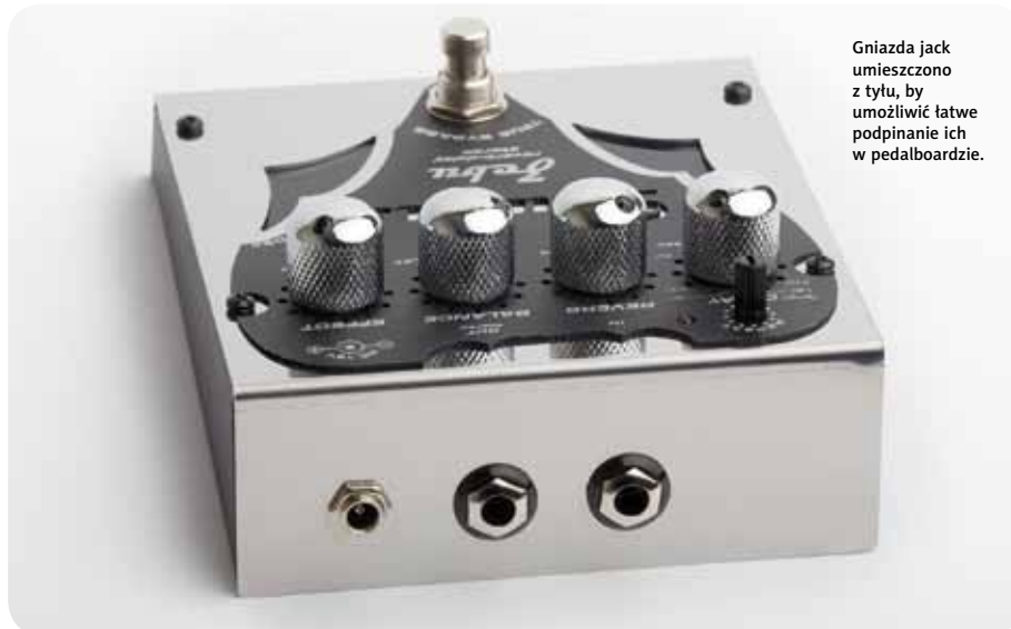
Gniazda jack umieszczono z tyłu, by umożliwić łatwe podpinanie ich w pedalboardzie.

Powtórzenia delaya są naturalne, lecz trochę spłaszczone. W żaden sposób nie podrasowują brzmienia. Procesor DSP to jak na razie najlepsza metoda, by w miarę tanio i z dobrym skutkiem rywalizować z analogowymi konstrukcjami.